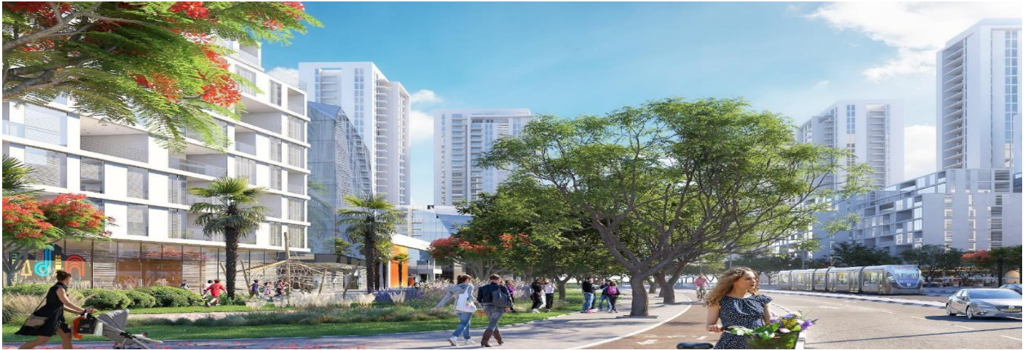
תכנית להתחדשות שדרות קוגל – השדרה הקהילתית, משרד אדריכלים אלונים גורביץ